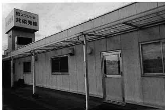
淀川工業会仮事務所外観