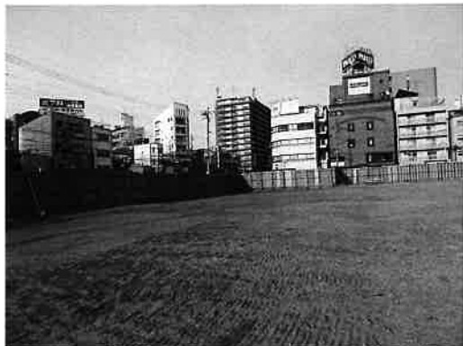
淀川産業会館・もと淀川区役所跡地の様子

事業の具体化のため、淀川産業会館を解体し、昨年9月には、工業会事務所を移転することになりました。同時に、定期借地権設定収入を得るとともに、解体費用、移転費用や新事務所の取得費用などへ支出しました。収支は想定された内容で推移しています。