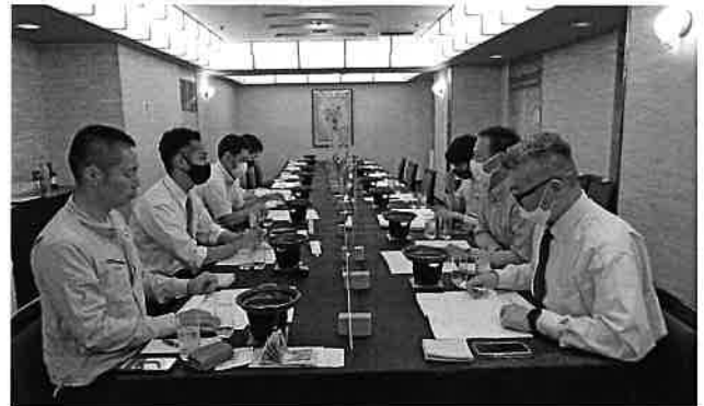
「熱心な議論を交わす」

新型コロナウイルスの感染拡大により、2年度、3年度は「書面決議」での総会となりましたが、今年度は会員が出席しての開催となりました。