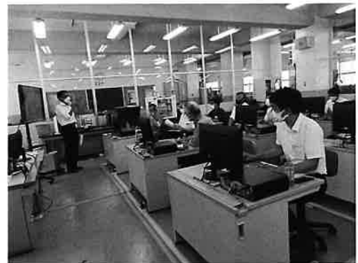
「板垣校長先生より学校紹介」

工業会では会員の皆様に参加募集を行ったところ、10社より見学会参加の希望が寄せられ、6月30日に淀川区長をはじめとする区職員の方々と共に東淀工業高校を訪問いたしました。