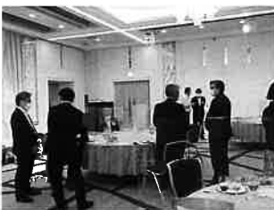
▲ 懇親タイムの様子

懇親会では自席を離れず飲食、情報交換は“懇親タイム”を設定、マスク着用でお願いしました。