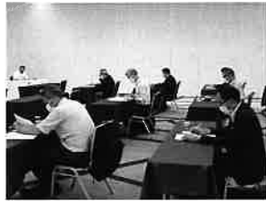
▲ 理事・運営委員の皆様