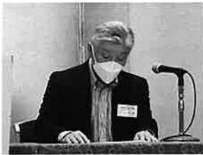
▲ 三宅会長により議事進行