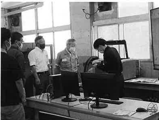
「学校にある機械設備についての紹介」