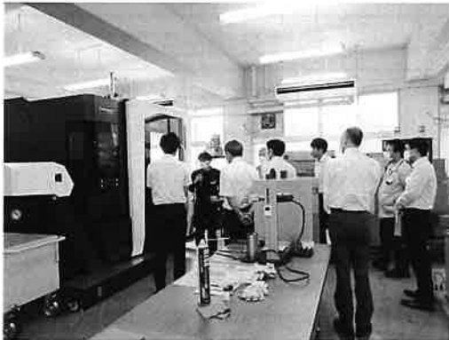
「マシニングセンタの前で操作説明を受ける」

専門高校においてデジタル化対応装置の環境を整備することにより、最先端の職業教育を行う「スマート専門高校」を実現し、地域の産業界を牽引する人材を育成するため、文部科学省が経費補助を行い、令和3年度末にマシニングセンタが設置されました。