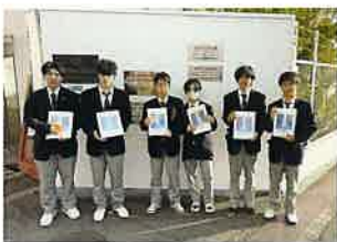
▲ 日本化学機械製造(株)

日時：令和6年11月21日(木) 13:30～15:00 場所：藤原金属(株)/日本化学機械製造(株)/協同シャフト(株)/ (株)特発製作所/ハカルプラス(株)/(株)エイトテック/ 日澱化学(株)/田岡化学工業(株)/(株)石戸電機製作所 の9工場