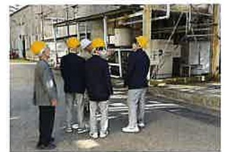
▲ 日本化学機械製造(株)