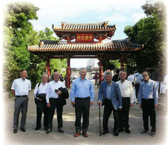
▲「守礼門」沖縄県指定有形文化財 (令和6年11月撮影)

そして、地域貢献事業として開催している東淀工業高校在学生の会員企業への工場見学では、多くの企業にご協力頂き、ありがとうございました。学生たちが