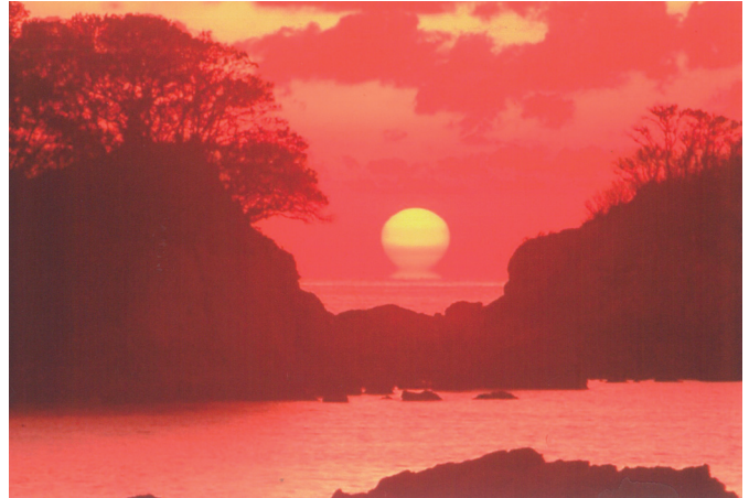
▲ 高知県宿毛市「だるま太陽」

民間の経済展望でも、新型コロナが収束しないなか、経済活動の回復ペースは大幅に鈍化し、新型コロナ前の