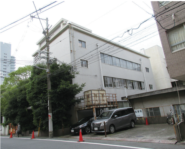
▲ 現在の淀川産業会館