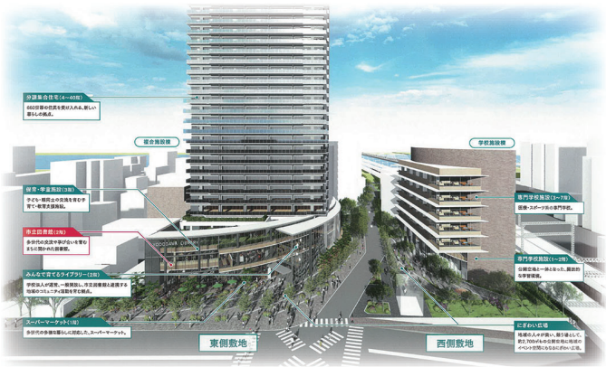
「区役所跡地複合施設イメージ」

今後は、どのような形で工業会事務所等を事業計画の中で取得していくのか、事業者と話し合っていくこととなります。引き続き、会長を中心に取組を進め皆様にご報告をしていきます。