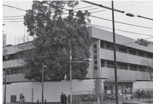
◀もと淀川区役所解体工事の様子

すでに、もとの区役所跡地では解体工事が始まっています。引き続き、会長を中心に事業者と具体の協議を重ね、結果を報告いたします。