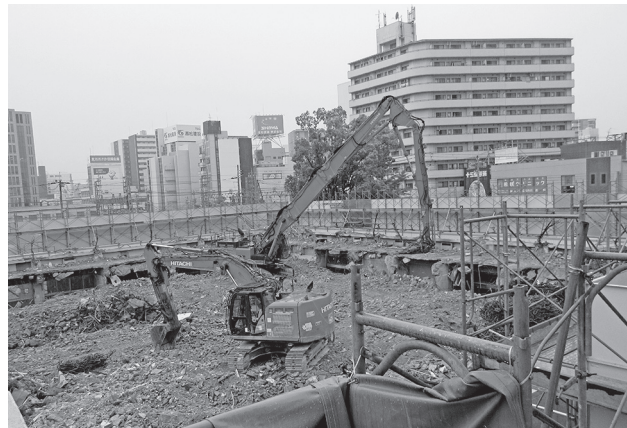
「もと淀川区役所の解体現場」

もと淀川区役所跡地の開発計画は、今年の1月から工事が着工されており、すでにもと淀川区役所は跡形もなくなっています。