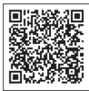
ハローワーク 淀川チャンネル

育児休業給付ってどんな人がもらえるの? 受給金額の目安は? 延長要件は? など、初めて制度に触れる方にも分かりやすいよう、具体例や図を交えながら説明しています。