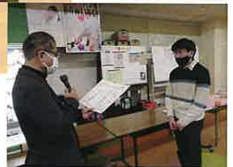
門脇委員長より賞状の授与(準優勝) ▶