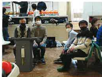
【準優勝】 日本化学機械製造㈱チームのメンバー