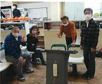
【優勝】 株薫芽チームのメンバー