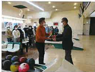
◀ 前回優勝チームにレプリカ贈呈