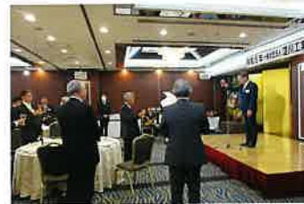
祝宴では和やかに ご歓談▶