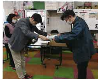
◀ 日刊工業新聞社より賞状の授与(優勝)