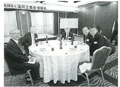
「笑顔が絶えません」

総会終了後、会場を変え賑やかに懇親会を開きました。今回は、アクリル板をなくし、自席を離れての名刺交換や交流が行われるなどコロナ前のように、和やかに行うことができました。