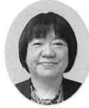
淀川公共職業安定所