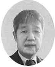
淀川労働基準監督署