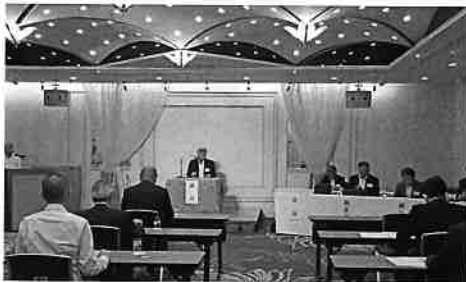
▲スムーズに議事運営