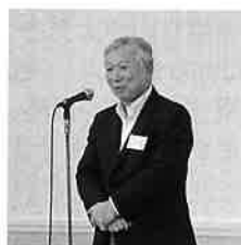
▲三宅会長あいさつ