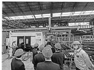
◀◀◀ ヘルメットをかぶり 見学する生徒たち ◀◀◀

今年も有意義な見学会となるよう多くの会員企業の皆様のご協力・ご支援をお願いします。